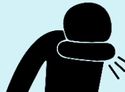
Коли кашляєте, прикривайте рота ліктем або серветкою