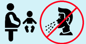
Тримайтеся подалі від немовлят та вагітних жінок