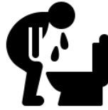
Блювання після кашлю