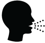
Кашель, що посилюється